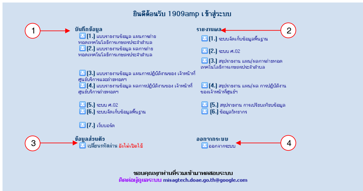
รูปที่ 2 แสดงหน้าจอหลักของระบบ ของเจ้าหน้าที่ศูนย์ฯ